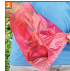
Im Beutel positionieren