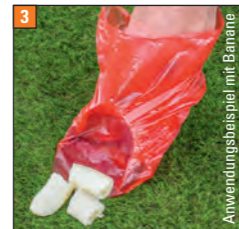
Anwendungsbeispiel mit Banane

Mit der Spitze seitlich gegen den Haufen schieben