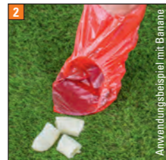
2 Vor dem Haufen auf die Aufnahmeplatte ablegen

Teile in die Öffnung hebeln und eventuell nachfassen