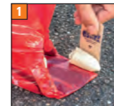
1 PAPP-SPATEL: Hervorragend für den Sondereinsatz bei widerstehenstigen Hundehäufchen und Untergrund wie z. B. Asphalt, Splitt.

(3) Beim Abziehen des Beutels verschwindet die Spitze zusammen mit dem Häufchen im Inneren und wird so gleich mit entsorgt.