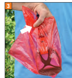
Beutel rückseitig festhalten