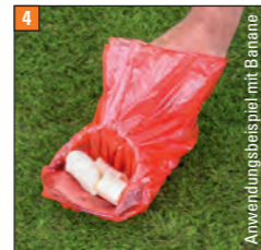
Anwendungsbeispiel mit Banane

Teile in die Öffnung hebeln und eventuell nachfassen