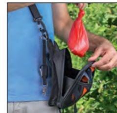
Vollen Kotbeutel einfach in der O'SHiT!® WALKYBAG verstauen

Beutel zuknoten, mitnehmen und im eigenen Restmüll entsorgen.