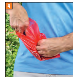
Beutel mit Hand ausformen