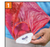
1 PAPP-SPITZE: Fixiert jede Art von Kotbeutel und schützt diesen zusätzlich bei sehr rauem und steinigem Untergrund.

PAPP-SPITZE: Fixierung + Schutz der Kotbeutel PAPP-SPATEL: Unterstützung bei der Kotalaufnahme