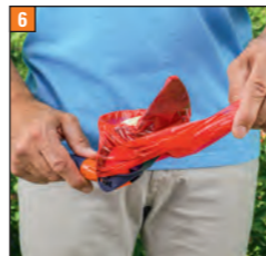
6 Beutel langsam weiter nach oben ziehen

Beide Teile sind sauber von einander getrennt in der Hand