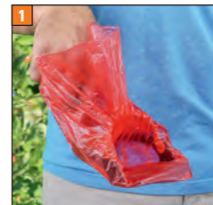
1 POCKET-SCOOPY mit Beutel bestückt und einsatzbereit

Eine leichte Schub- und Hebelbewegung befördert das Häufchen mühelos in den Auffangkäfig.