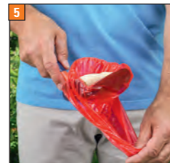
5 Beutel von hinten fassen und in Richtung Spitze stülpen

Durch Umstülpen des Beutels in Richtung Spitze wird er sauber vom POCKET-SCOOPY abgezogen.